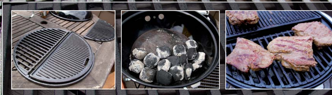
Der Ring wird mit einem Rost und dem Griddle (Gusseisenplatte) bestückt (links)

Ein Ring mit zwei Elementen: der Cast Iron Grate 2grillers joy für 37-cm-Grills. Mit drei Elementen (3grillers joy) oder vier (4grillers joy) gibt es ihn auch für größere 48-cm- oder 57-cm-Kugeln. Die Module, wie hier die Gusseisenplatte (Griddle), kann man zusätzlich kaufen